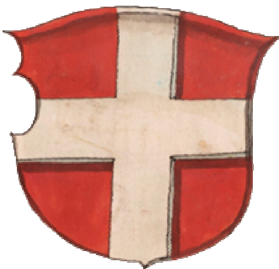
Історичний герб Волині