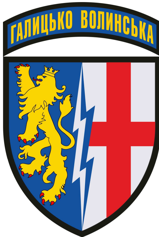
Нарукавна емблема 1-ї Галицько-Волинської радіотехнічної бригади